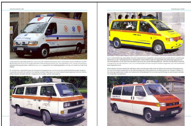
Krankentransportwagen (links) und Baby-Notarztwagen (Abbildungen Musterseiten)