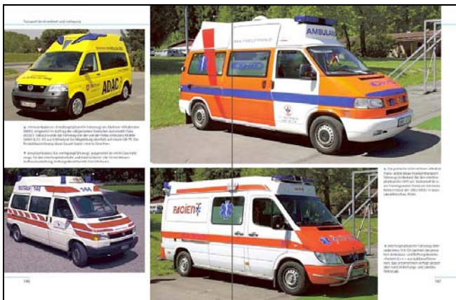
Interessante Fahrzeugtypen aus zahlreichen Staaten Europas und der Welt bieten eine breite Übersicht in brillanter Bildardarstellung (Abbildungen Musterseiten). Im Bild Notarzteinsatzfahrzeuge (NEF, links) und Interhospitaltransfer-Fahrzeuge (IHT).