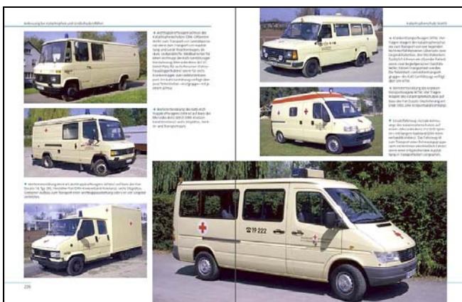
Einsatzfahrzeuge des Sanitätsdienstes im Katastrophenschutz (Abbildung Musterseiten)