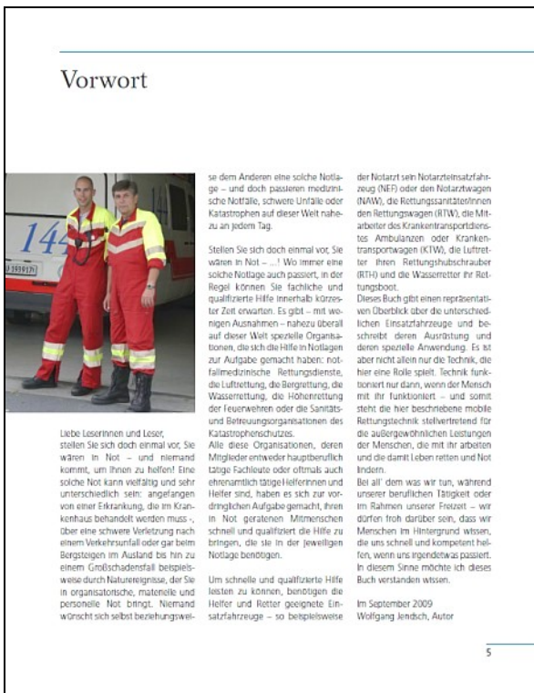
Vorwort zum Buch (Abbildung Musterseite)